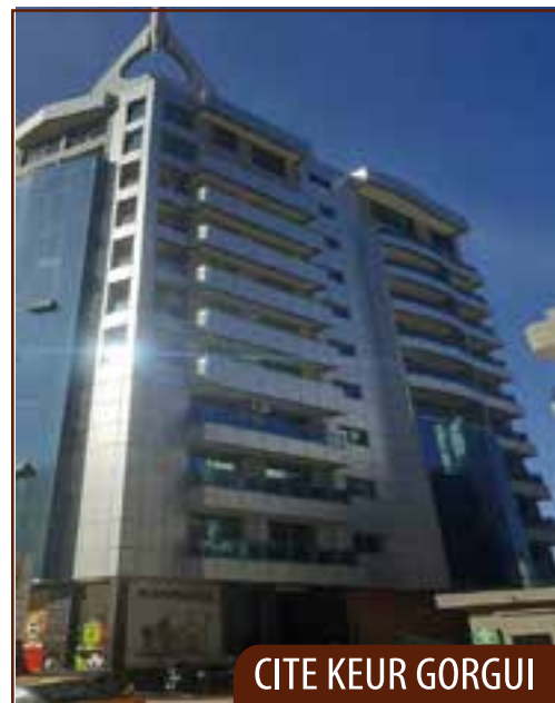
CITE KEUR GORGUI